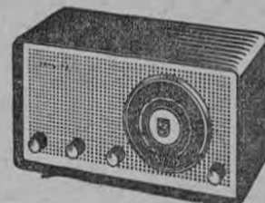
Modelo FANTASIA Atractivo radio de 3 bandas, 5 tubos $ 298.00