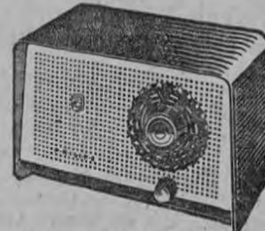
Modelo PICCOLINO Precioso radio de onda larga, 4 tubos. $ 185.00

Y... lo mismo que los colores, el sonido de estos receptores Philips es claro y hermoso de modo que forman un conjunto armonioso.